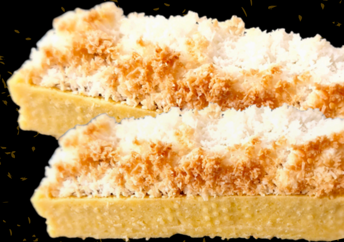
TARTA DE COCO